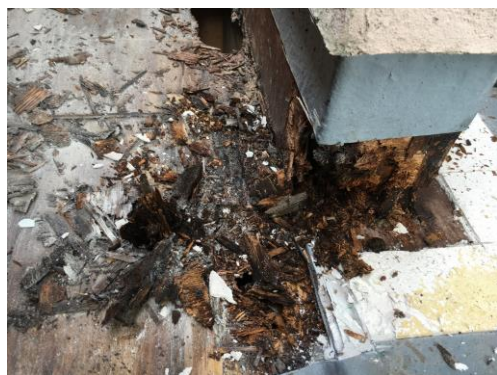
雨漏れによる腐食