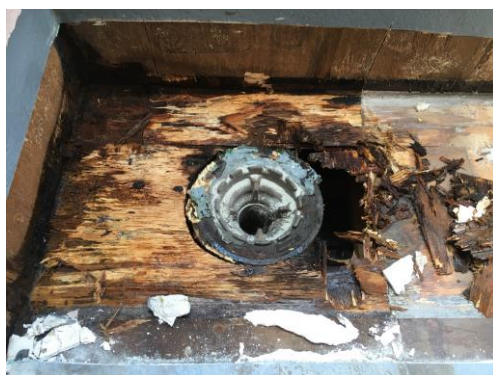
雨漏れによる腐食

私達ホームインスペクターは、家主様に代わり屋根裏や床下を点検。雨漏れの有無や白蟻の被害をチェックします。私達が守るのはあなたの命と財産です。