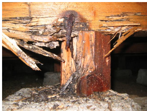
シロアリによる食害

あなたのご自宅の床下は大丈夫？ 知らない間に白蟻の被害にあっていませんか？ 家の中で白蟻を見つけた時にはすでに被害にあっています。